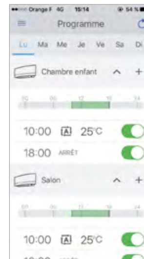
Programmation quotidienne et hebdomadaire.