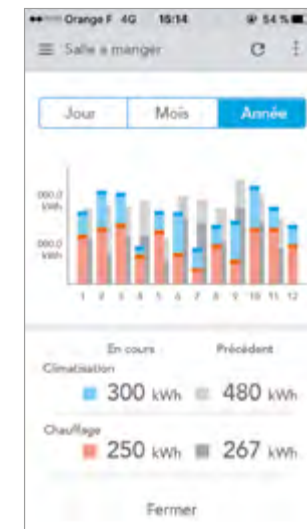
État des consommations énergétiques.